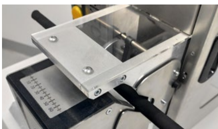
Prosta obsługa, standard przemysłowy