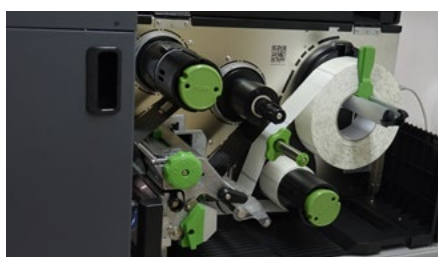
Zintegrowana drukarka termotransferowa