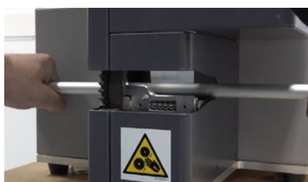
Prosta obsługa, standard przemysłowy